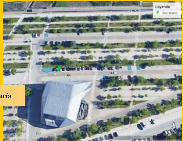
Centro de competición. Secretaría

Aparcamiento: Recomendable usar los amplios aparcamientos en las inmediaciones de la zona de secretaría.