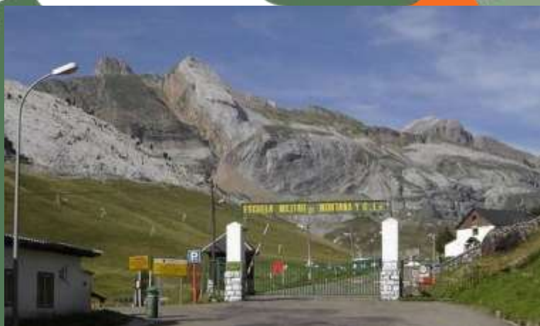
Entrada a la EMMOE y vista de la estación de esquí y de la famosa "Zapatilla"