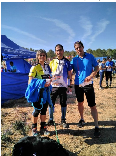
Foto de amigos del Club en el Costa Cálida

Y allá que nos presentamos con la mayor ilusión del mundo 14 amigos para representar lo mejor posible a nuestro Club, y hacer un gran papel como siempre hacemos desde hace mucho tiempo, somos pocos pero de mucho nivel, el día que consigamos ir unos pocos más será impresionante...no nos cansaremos de repetir este consejo para todos los socios del club, una bonita experiencia.