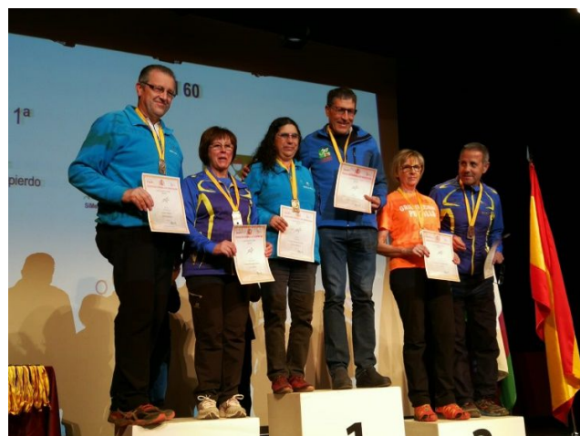
Entrega de Premios Liga Nacional 2019. Nuestro Presidente FARO